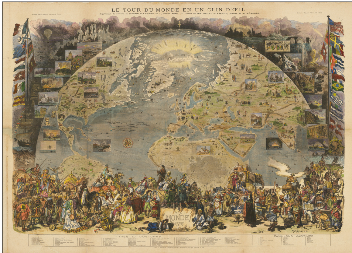
1876, Le Tour du Monde en un Clin d'Oeil , 73x101 cm/28x39 inches

Pictorial view of the world. Originally issued uncolored, color was added later. Map is projected as a view from space and details the world roughly from the Equator to the North Pole and from California to India. Flora, fauna, historic events, cultural artifacts, and indigenous people are represented pictorially. The Sargasso Sea is illustrated in the middle of the Atlantic. Includes inset views illustrate places and moments of special interest including mirages in the Pacific, a ship burning at sea, Niagara Falls, Chicago, oil wells, gold mining, Hindu cremation, Chinese Junks, Tuareg warriors, an avalanche, etc. also includes lists of the nations and maritime flags. Shows sketches of some 79 individuals in 'traditional costumes'. To either side of the main view are flags of major nations, sailing ships, volcanoes, and other imagery. Include an ice free polar sea north of Greenland labeled 'Mer Libre?' No doubt this is a nod to hopes that a Northwest Passage might still exist. Union Pacific and Trans-Atlantic shipping lanes are noted. The achievements of various explorers are noted in both Africa and the Arctic. This view was drawn by M.M Scott and Daniel Vierge and engraved by Fortune Meaulle for the January supplement to the Le Monde Illustré . There are two versions of the map. The first, issued January 1, 1876, includes a title. The second, published January 22, 1876, lacks the title.