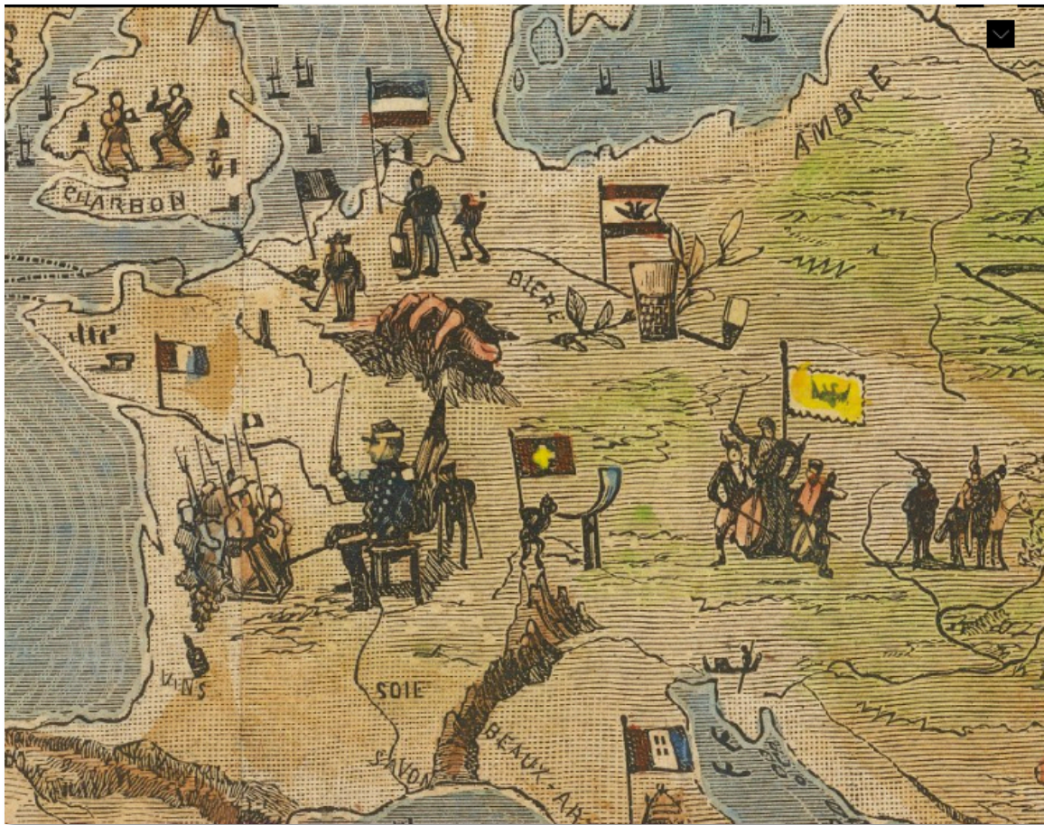
England & France